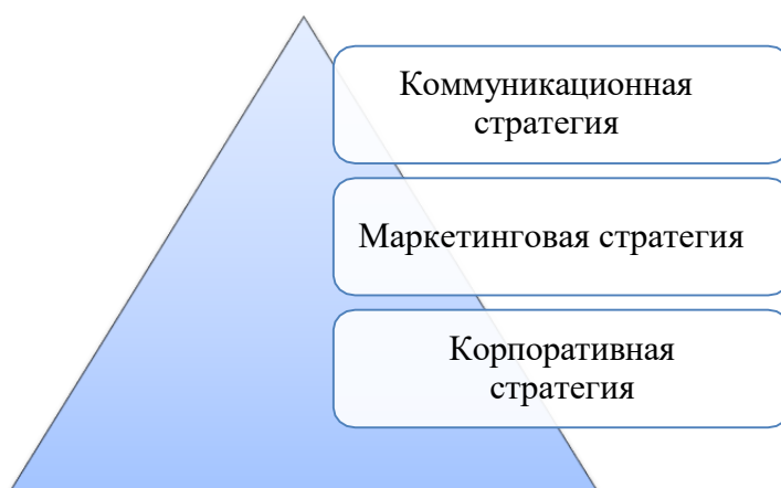
Рис.1. Соотношение стратегий предприятия